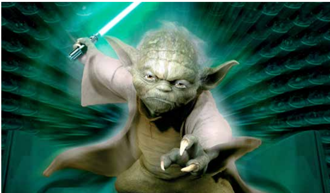
Fra Star Wars III

våben. I det hele taget går det som en rød tråd i fantasiens fremtidsbilleder, at mennesket grundlæggende er et aggressivt, grådigt og ondskabsfuldt væsen, der kun kan overleve ved at bruge våbenmagt og myrde modstanderne. Påstanden bevises af storfilm som Star Wars , Avatar , Star Gate og utallige andre film og science fiction romaner om tilsvarende emner. Men disse og mange andre forestillinger om fremtiden skaber tilsammen størstedelen af menneskenes syn på og forventninger til den usikre størrelse, der kaldes fremtiden .